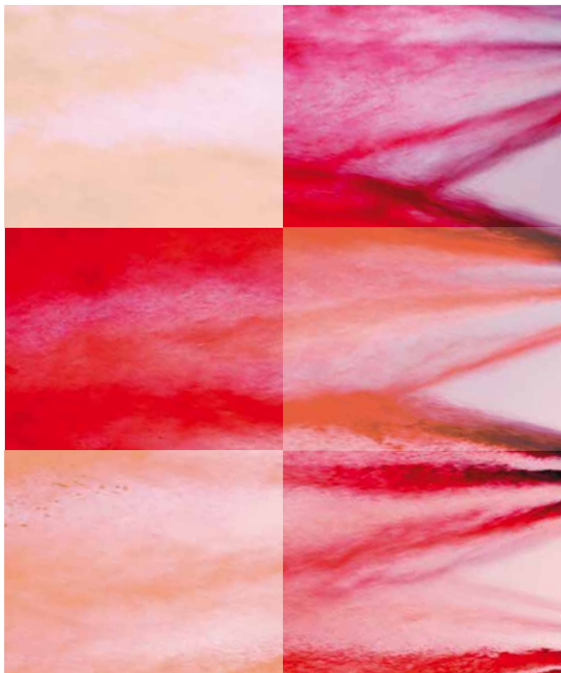
Architecte : Bleicher Architectes Suites Hôtel Porte de Vanves - Senoual 2525 YW2661

Interpon D1036 Textura est une gamme de revêtements en poudre très résistante aux rayures et aux chocs, parfaite pour les zones à fort trafic. L'aspect texturé fin masque les imperfections et offre une solution d'entretien facile et économique pour les espaces publics.