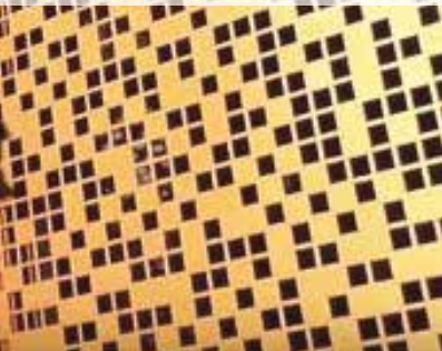
Architectes : Imholz Architectes et Associés Salle des Fêtes de Moulins Interpon D2525 - Ordos 2525 Sablé YW3871